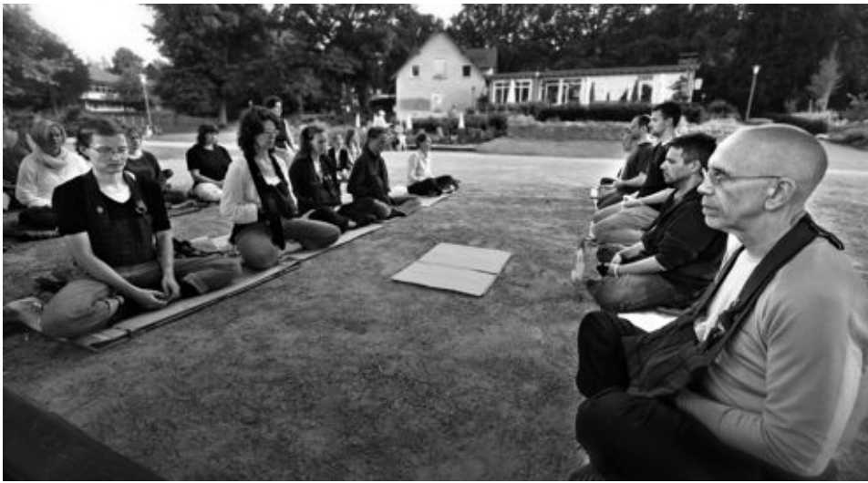
Die Teilnehmer des Straßenretreats in Bielefeld bei der täglichen Meditation mit zahlreichen Besuchern aus Bielefeld.